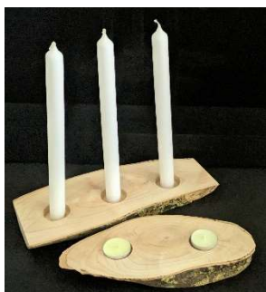
Hout: Wim Nobel